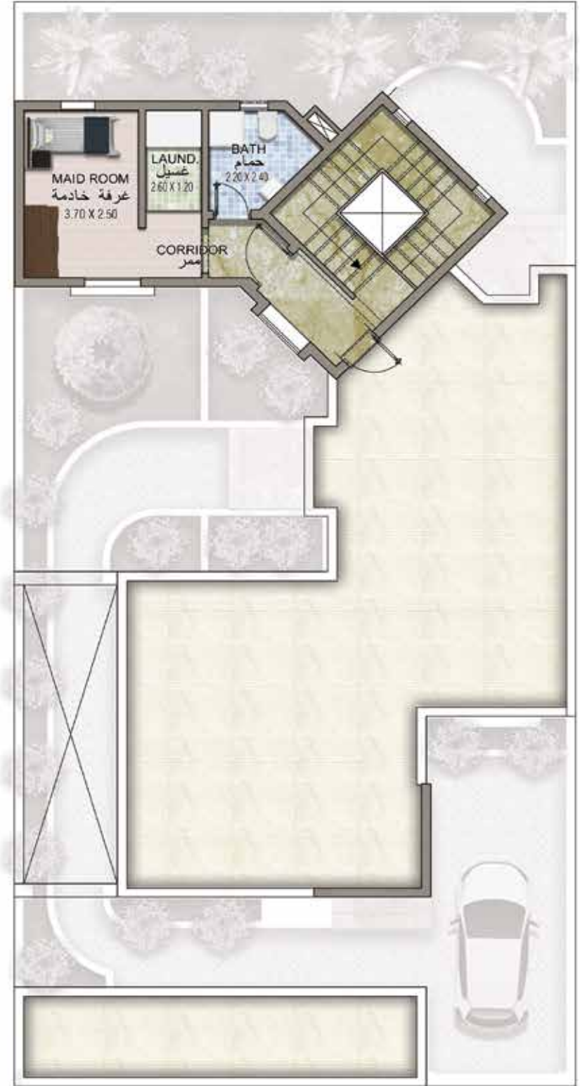
ROOF ANNEX PLAN

إخلاء المسؤولية - دار الأركان: ما لم يذكر خلاف ذلك أعلاه، جميع الملحقات والتشطيبات الداخلية مثل ورق الجدران والشريبات والأثاث والإلكترونيات والمفروشات والستائر وعناصر تنسيق المواقع الطبيعية والصناعية والأرضية والميزات، وحمامات السباحة وغيرها من العناصر المعروضة في الكتيب أو داخل عرض الشقة / الفيلا أو بين حدود قطعة الأرض والوحدة، لا تعد جزءاً من الوحدة القياسية وقد عرضت لأغراض توضيحية فقط. المناطق معروضة وفقاً لمخططات وقت الطباعة؛ وقد تختلف الأبعاد الفعلية في حالة التنفيذ النهائي، وليس المقصود منها أن تكون جزءاً من أي عقد أو ضمان.