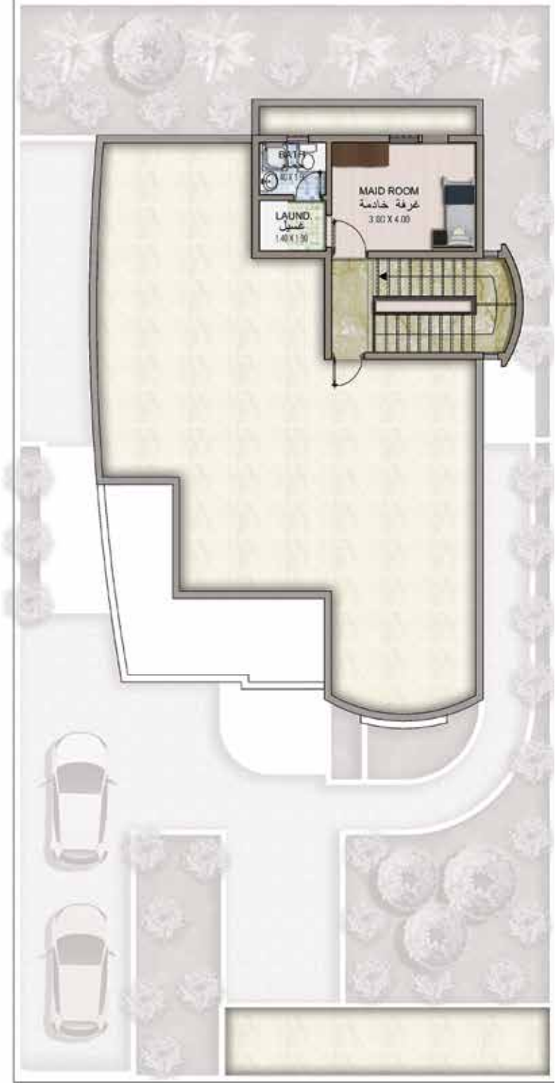
ROOF ANNEX PLAN

إخلاء المسؤولية - دار الأركان: ما لم يذكر خلاف ذلك أعلاه، جميع الملحقات والتشطيبات الداخلية مثل ورق الجدران والشريبات والأثاث والإلكترونيات والمفروشات والستائر وعناصر تنسيق المواقع الطبيعية والصناعية والأرضية والميزات، وخدمات السياحة وغيرها من العناصر المعروضة في الكتيب أو داخل عرض الشقة / الفيلا أو بين حدود قطعة الأرض والوحدة، لا تعد جزءاً من الوحدة القياسية وقد عرضت لأغراض توضيحية فقط. المناطق معروضة وفقاً لمخططات وقت الطباعة؛ وقد تختلف الأبعاد الفعلية في حالة التنفيذ النهائي، وليس المقصود منها أن تكون جزءاً من أي عقد أو ضمان.