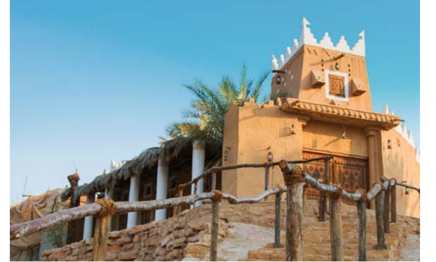
الدرعية "جوهرة المملكة"

مشروع يمثل جزءاً مهماً من رؤية المملكة 2030، إذ يُعتبر أحد أكبر مشاريع البنية التحتية تطوراً حتى تكون الدرعية أحد أبرز الوجهات السياحية في المملكة والعالم، بنمط معماري تتداخل في الأصالة والحداثة.