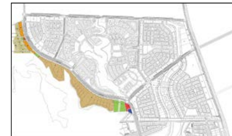
مخطط شمس الرياض العام

شمس الرياض بالازو، مشروع متكامل يقع ضمن التوسع المستقبلي لمدينة الرياض. يتضمن بالازو فرصاً استثمارية واعدة تشمل: أراضي تجارية وسكنية وفيلات مميزة.